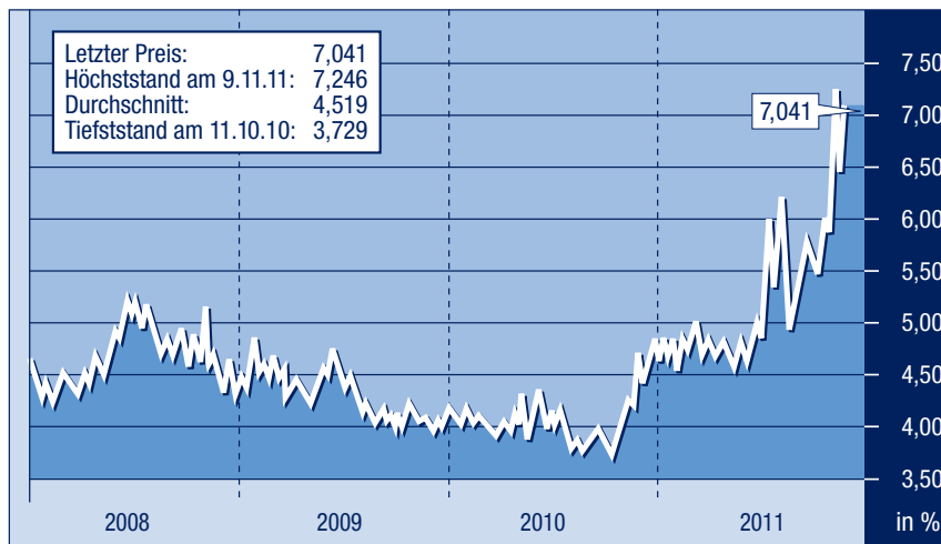
Rendite 10-jährige italienische Staatsanleihen

längerung von auslaufenden Staatsanleihen, nur unter Inkaufnahme von massiv höheren Zinsen abwickeln können. Folgendes Rechenbeispiel verdeutlicht die Auswirkungen dieses Zinsanstieges: Im nächsten Jahr werden in Italien von den total 1900 Milliarden Euro Schulden rund 300 Milliarden fällig, die zu neuen Konditionen verlängert werden müssen. Für zehnjährige italienische Anleihen verlangen die Investoren heute rund sieben Prozent Zins (siehe Grafik). Die resultierende Zinslast von 21 Milliarden Euro beträgt rund 1,5 Prozent des gesamten Bruttoinlandproduktes von Italien.