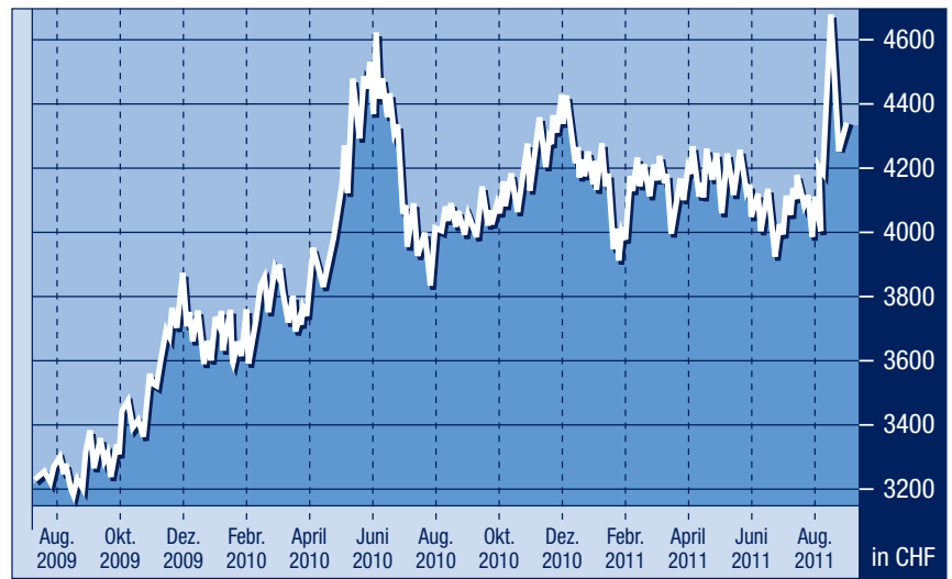
100 Gramm Gold in Schweizer Franken/ZKB ETF

zeigten vor allem bei Schweizer Firmen mit starker Exporttätigkeit (was für die meisten international tätigen Firmen zutrifft) deutliche, durch den Wechselkurs verursachte Bremspuren. Wie von uns bereits mehrfach erklärt, sind Veränderungen beim Umrechnungskurs im Ausmass der letzten Monate in jedem Fall erfolgswirksam, bei den Schweizer Exporteuren leider mit negativem Einfluss. Mit einer glaubwürdigen und vor allem erfolgreichen Intervention der SNB könnte hingegen das Schlimmste – zumindest in der Parität des Euro zum Schweizer Franken – überstanden sein. Kursrückgänge von 30 bis 40 Prozent innerhalb von zwei Wochen bei Werten wie ABB, Holcim, Sulzer, Fischer, Rieter, Geberit, Schindler und anderen bieten bei einer Währungsabschwächung des Frankens einiges