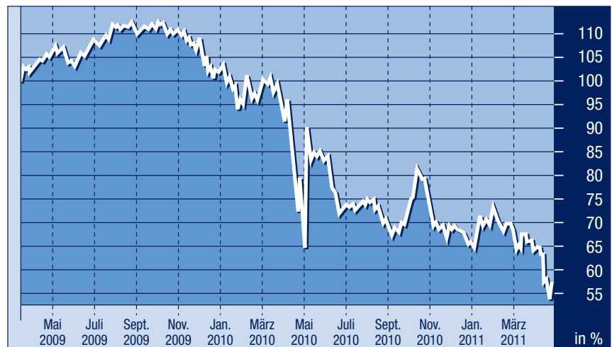
6% Griechenland 2019

Die Rating-Agentur Standard & Poor's droht, den USA das AAA-Rating abzuerkennen. Falls Washington keinen glaubwürdigen Plan zur Schuldenreduzierung vorlegen kann, werden die USA das höchste Kreditrating verlieren. Auch wenn die Aufnahme auf die sogenannte Wachtlist als Schuss vor den Bug zu deuten ist, besteht die reelle Möglichkeit einer Rückstufung mit der Folge von höheren Kreditzinsen. Der amerikanische Aktienmarkt hat am Tag des Warnschusses über zwei Prozent korrigiert. Als Reaktion darauf hat sich der weltgrösste private Anleiheninvestor PIMCO in seinem 237 Milliarden US-Dollar schweren Total Return Fund von allen US-amerikanischen Staatsanleihen getrennt. Der Spezialist für Schuldtitel erwartet eine Weginflationierung der Schulden und damit einen massiven Kurseinbruch für nominelle Papiere.