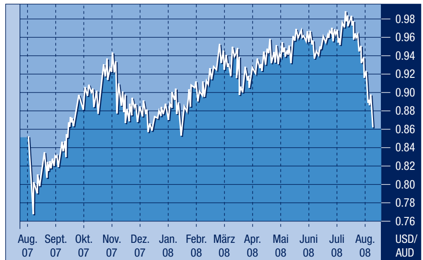
US-Dollar-Stärke gegen Australischen Dollar

Bundesbank-Präsident Weber beschwichtigt die aufkommenden Rezessionsängste in Deutschland mit seiner eigenen Wachstumsprognose: zwei Prozent für 2008 und ein Prozent für 2009. Übertrumpft wird Weber nur noch vom deutschen Bundesfinanzminister Peer Steinbrück, der als Schwarzmaler und Jammer-Deutschen bezeichnet, wer das Wort «Rezession» gebraucht. Weber verteidigt so die restriktive Zinspolitik der EZB; Zinssenkungen sind für ihn kein Thema. Steinbrück hingegen will die Steuerschattulle nicht zwecks Konjunkturförderung öffnen. Nicht er, sondern Wirtschaftsminister Glos soll sich um die Wirtschaft sorgen – und genau dieser fordert ein milliardenschweres Konjunkturprogramm. Die deutsche Konjunktur brillierte stets mit guten Zahlen. Die beschleunigte Rezessionstendenz in den wichtigsten Exportländern holt jedoch den Exportweltmeister Deutschland ein.